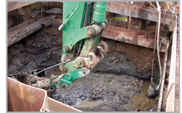
Sanierung einer Bodenverunreinigung