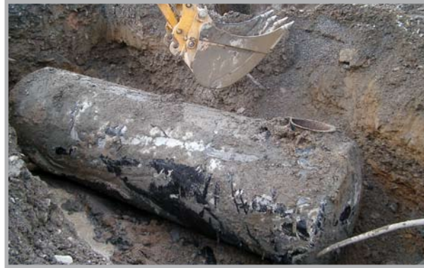
Untersuchung einer Betriebstankstelle